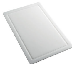
PLANCHE DE DECOUPE HDPE 27x42 CM